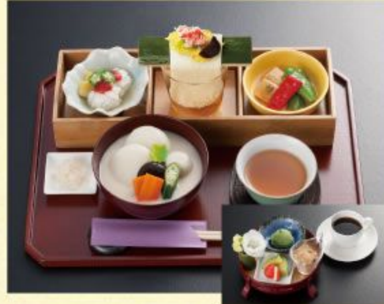
四季の餅膳セット.....1,545円 〈京雑煮と季節の小鉢三品付+デザートとコーヒー〉 四季の餅膳.....1,188円 〈京雑煮と季節の小鉢三品付〉