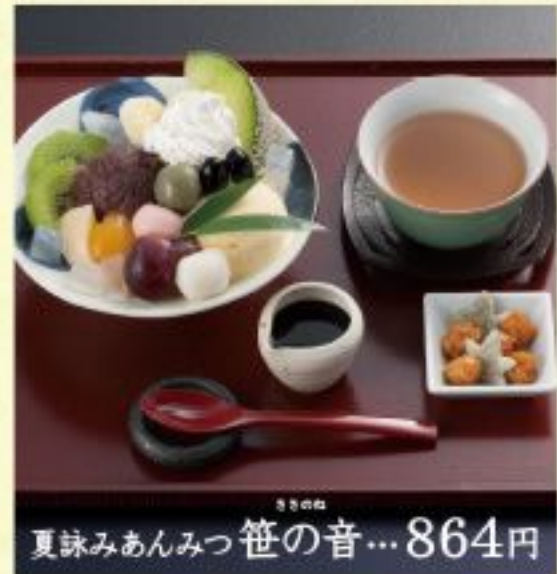
夏詠みあんみつ 笹の音...864円