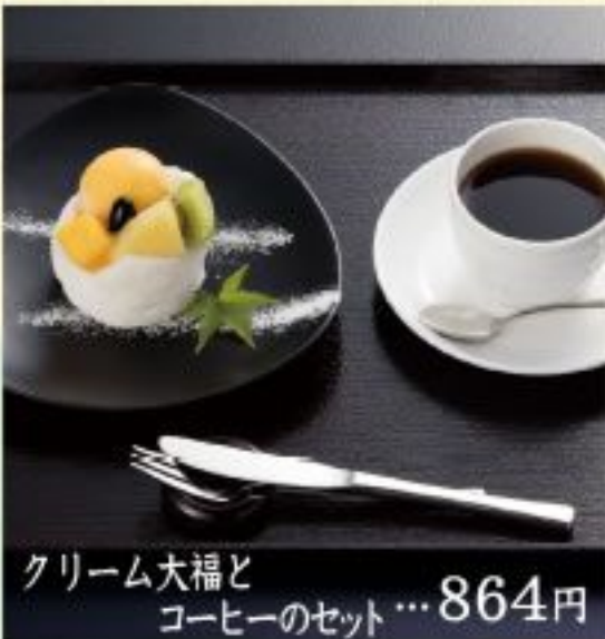
クリーム大福と コーヒーのセット...864円