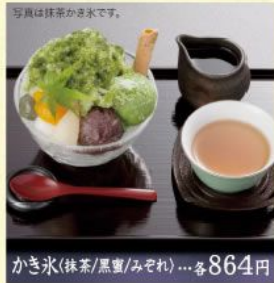
写真は抹茶かき氷です。 かき氷(抹茶/黒蜜/みぞれ)...各864円