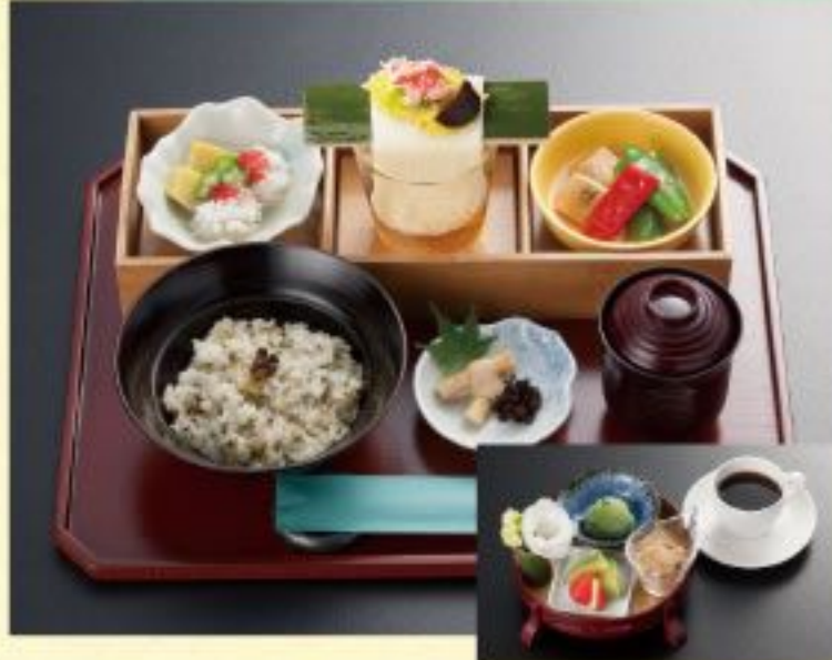
四季のおこわ膳セット.....1,545円 〈おこわと季節の小鉢三品+お口直し+デザートとコーヒー〉 四季のおこわ膳.....1,188円 〈おこわと季節の小鉢三品+お口直し〉

季節の小鉢三品(竹箱入)左から ● 麩の温蒸し ● 涼風そうめん ● 湯葉の揚げ浸し ※四季の餅膳、四季のおこわ膳共通です