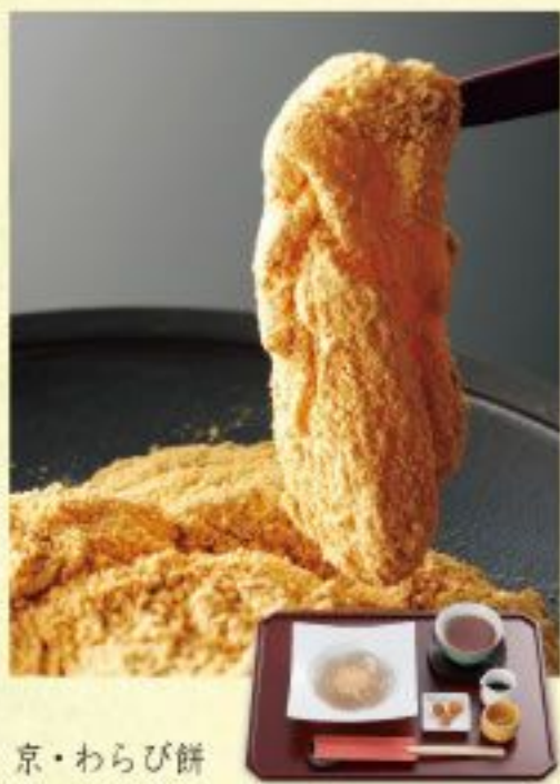
京・わらび餅 御門わらび 〈京きなこ・抹茶きなこ〉各648円