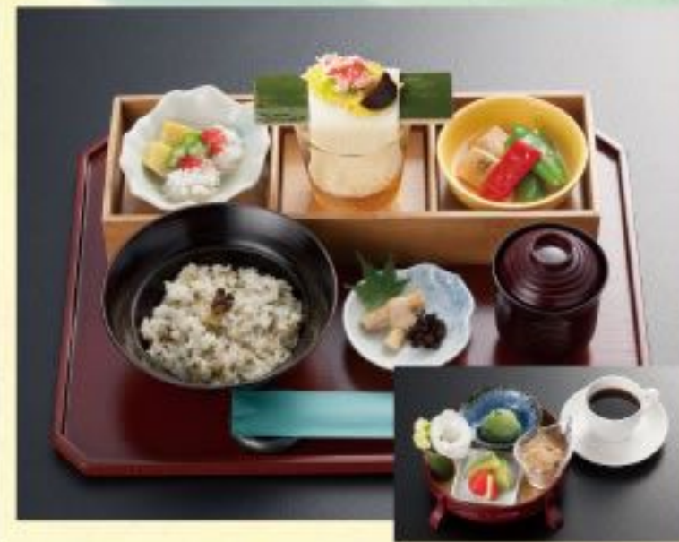
四季のおこわ膳セット.....1,545円 〈おこわと季節の小鉢三品+お口直し+デザートとコーヒー〉 四季のおこわ膳.....1,188円 〈おこわと季節の小鉢三品+お口直し〉

季節の小鉢三品(竹箱入)左から ● 麩の温蒸し ● 涼風そうめん ● 湯葉の揚げ浸し ※四季の餅膳、四季のおこわ膳共通です