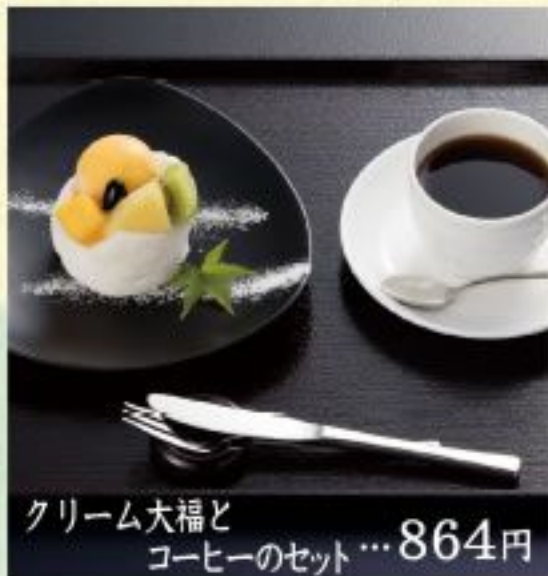
クリーム大福と コーヒーのセット...864円