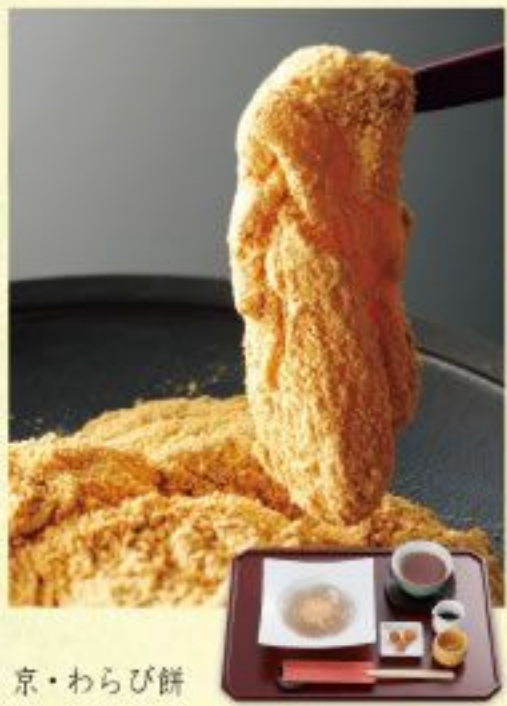
京・わらび餅 御門わらび 〈京きなこ・抹茶きなこ〉各648円