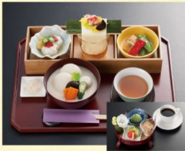
四季の餅膳セット.....1,545円 〈京雑煮と季節の小鉢三品付+デザートとコーヒー〉 四季の餅膳.....1,188円 〈京雑煮と季節の小鉢三品付〉